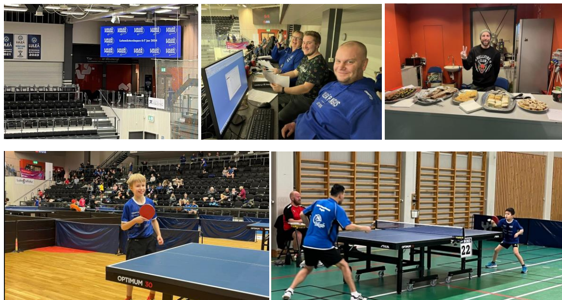
Bilder från 2024 års Luleåmästerskap

Vi har nu i veckan fått klart med föreningsservice/lokalbokningen på LEA, att vi kan genomföra Luleåmästerskapen den 5-6 januari 2025 .